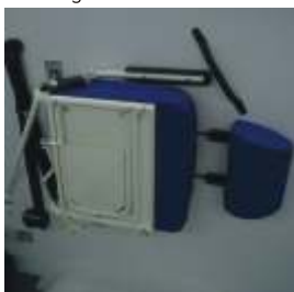
Sitz zur Seitenwand klappbar