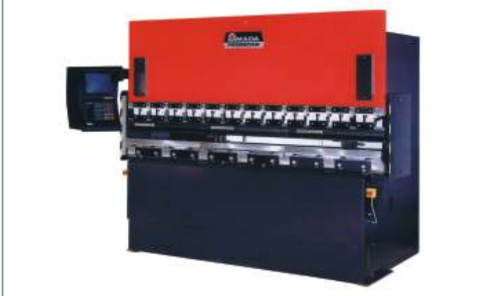
CNC- Abkantpresse ITS-2-Serie

Höchstleistung im Laserschneiden - auch für Großformate geeignet!