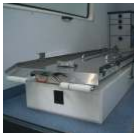
Patientenlagerung nach EN 1789