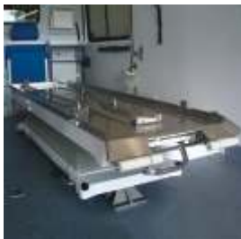
HYDRO-PLUS nach EN 1789