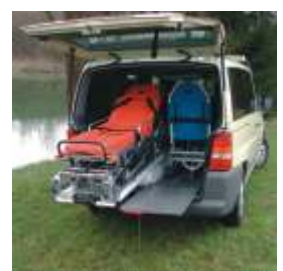
Ausbau für unqualifizierten Krankentransport (Taxi)