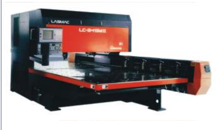
Laserschneidmaschine LC-Alpha 2415