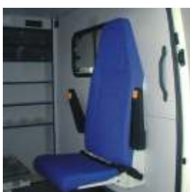
Klappsitz mit hoher Rückenlehne (Option: Armlehne rechts + links)