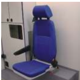
Sitz auf Radlauf drehbar mit integriertem 3-Punkt-Gurt