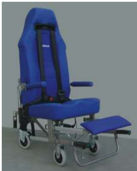
Komfort-Tragestuhl nach EN 1789 (in Verbindung mit Beladeklappe) mit Hosenträgergurt